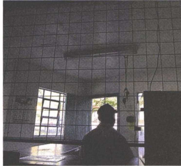
BREU. Prédio da Mobilidade Urbana na Tamarutaca ficou sem luz

O governo petista possui extensa lista de fornecedores com atraso de repasse, sob justificativa da acentuada queda na arrecadação do município e a crise econômica no País. A dilatação de pagamentos, em média, atingiu de cinco a seis meses série de