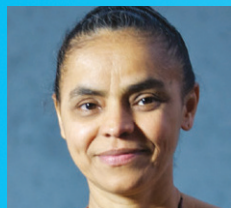
MARINA SILVA (Ex-senadora e ex-ministra do Meio-Ambiente)