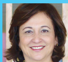
KÁTIA ABREU (Senadora e colunista da Folha)