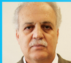
CARLOS AFONSO NOBRE (Secretário de políticas e programas do Ministério da Ciência, Tecnologia e Inovação)