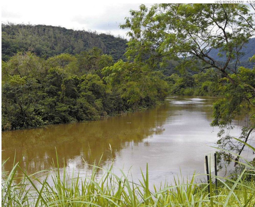
Rio Cubatão é uma das fontes de abastecimento de água para parte da população da Baixada Santista